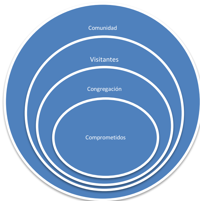
Diagrama de círculos concéntricos

El proceso de asimilación de consiste en hacer pasar a los visitantes por los siguientes tres pasos: